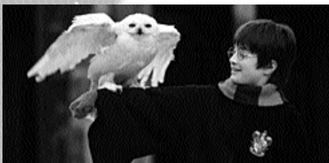
.Harry in een scene uit de film

Halverwege Harry Potter is niet helemaal een juiste kop voor dit artikel. Ik heb de eerste drie van de inmiddels vier delen gelezen: Harry Potter en de Steen der Wijzen, Harry Potter en de Geheime Kamer en Harry Potter en de Gevangene van Azkaban. En nu verheug ik me dus al erg op het lezen van deel vier: Harry Potter en de Vuurbeker. Maar wat nog leuker is, is dat het niet bij deze vier delen blijft; het worden er maar liefst zeven. Nog lang niet in Nederland natuurlijk, dat zal nog wel even duren, maar toch, het gaat ooit gebeuren. Bovendien zijn Warnerbros al druk bezig met de verfilming van deel 1.